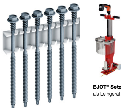
EJOT® Setzgerät ECOSET als Leihgerät erhältlich.

Halteteller HTV 82/40 Halteteller HTE 82/40 Halteteller HTV 82/40 F Flachdachprofil FP Setzgerät ECOSET Steckschlüsseinsatz