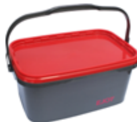
Im praktischen Kunststoffbehälter

Setzgerät ECOSET als Leihgerät erhältlich Artikelnummer G000000076 Infos siehe Seite 33